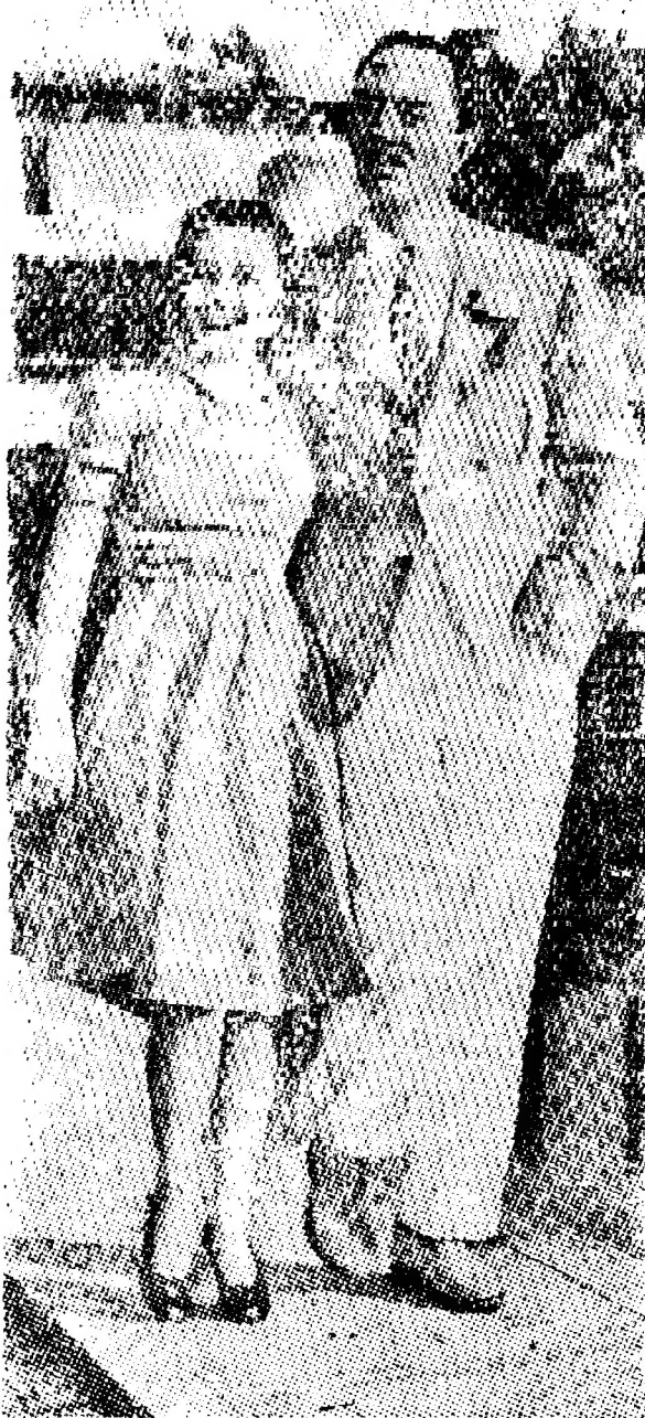
威廉鮑惠爾與新太太合影

他倆同時協議，對於外間的謠傳，決置之不理。他倆認為這是最好的對付辦法。現在他倆所祈求的是能生一個小天使。狄埃娜曾說，她現在再沒有比有一個孩子更喜愛的事。